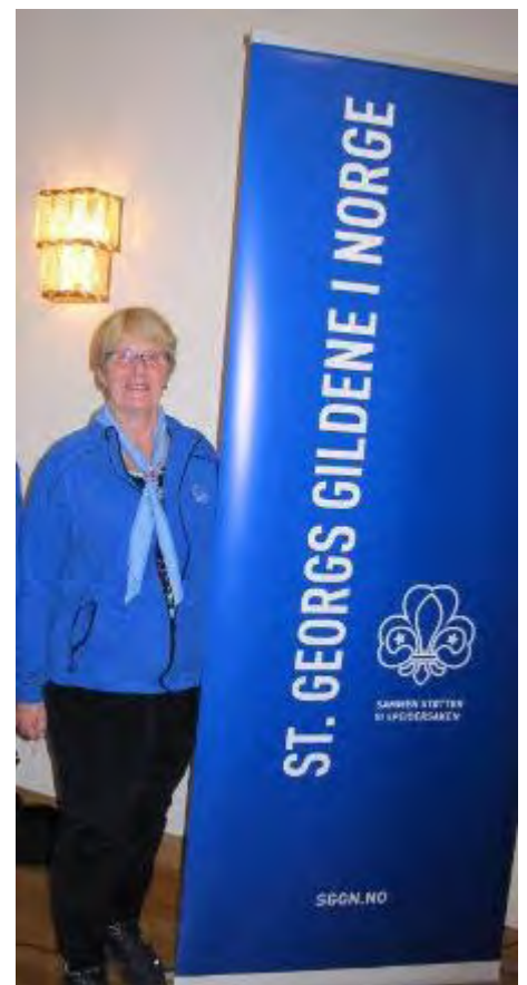
Nytt i profilering: Jakke, skjerf og roll-up.

I 2010 og 2011 økte medlemstallet litt, men i 2012 ser det ut til at vi har en nedgang. Til tross for nystarter, øker ikke det samlede antallet av gilder. Skal vi bli nedslåtte, eller skal vi stikke fingeren i jorda og si at med nåværende alderssammensetning i medlemsmassen, tar det lenger tid å øke i antall enn det vi la inn i langtidsplanen? Skal vi fortvile, eller skal vi glede oss over nye medlemmer og nye gilder og samtidig arbeide med kvalitet i program og fellesskap? Veien videre skal vi finne sammen. På landsgildetinget i Langesund skal vi feire alt vi er og får til, og vi skal strekke oss mot nye mål.