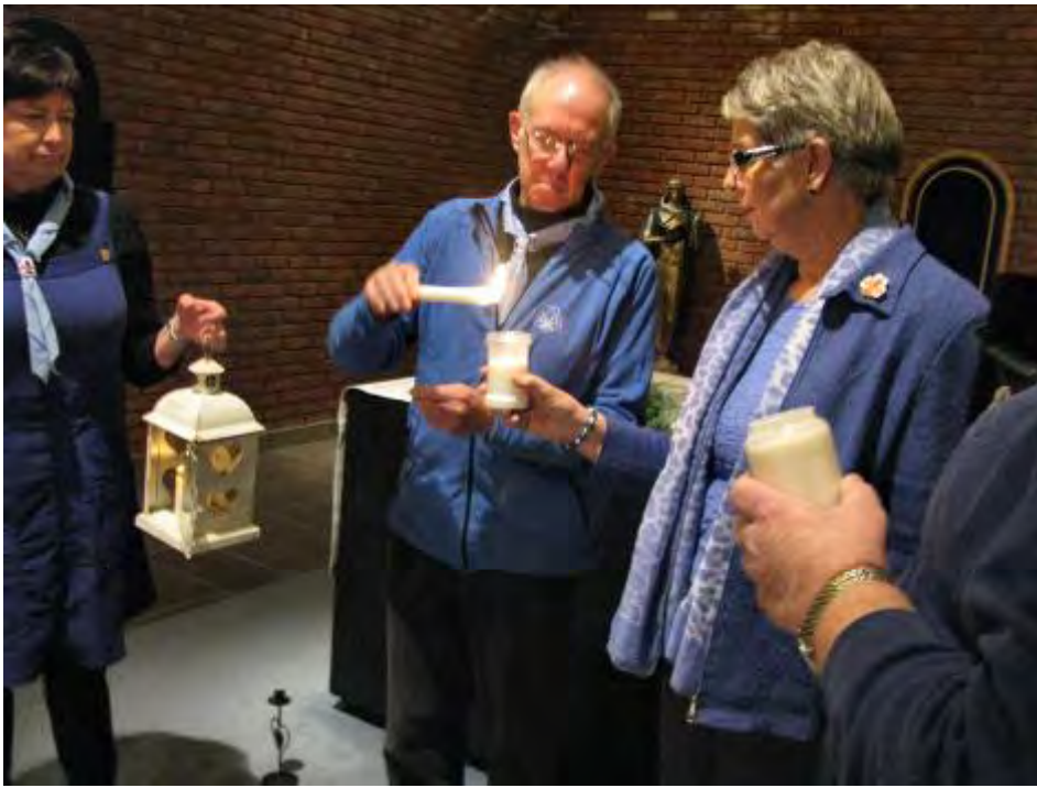
Fra Lunden kloster.