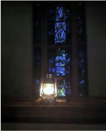
Fredslyset i Hoeggen kirke

Fredsflammen spredte seg rundt om i landet også i 2012. Fra Oslo ble den kjørt med bil til Molde og Kristiansand, NSB fraktet den fra Kristiansand til Stavanger, mens Hurtigruta spredte den langs kysten, sydover til Bergen og nordover til Hammerfest. Den symbolhandlingen det er, å ha en flamme fra Betlehem brennende i adventstiden, ble ekstra meningsfull i fjor på grunn av krigshandlinger i Gaza.