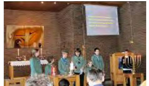
Speiderne har tekstlesing og lystenning vekselvis.