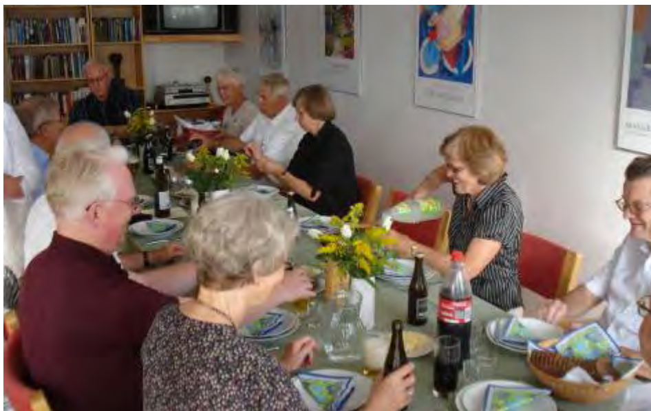
Fra vårt samvær med vennskapsgildet i Hillerød, Danmark.