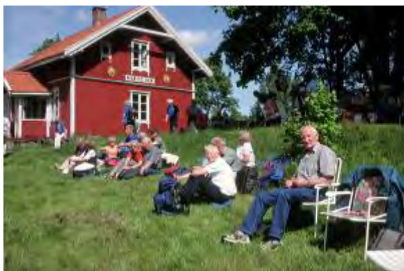
Besøk på Kvernmoendagen 2002

Gildet i Porsgrunn ble stiftet 21. november 1960 under navnet St. Georgs Gilde på Herøya. Sitt nåværende navn fikk det i 1995. Flere av de første medlemmene er fortsatt aktive, og gildet har nå passert 50 medlemmer. Da gildet i 2011 ble oppfordret til å arrangere tinget i 2013, fant vi det naturlig å takke for tilliten og brette opp ermene.