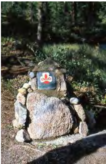
Ved hvert av stedene vi hadde «Klondyke» ble det satt opp en varde som viste at vi hadde vært der.

Vi gledene gjemmer og sorgene glemmer fra tiden som nå har passert revy. Men skulle det på vår himmel komme en dunkel sky så bryter sola alltid frem påny. Vårt gilde skal fortsatt gi grunnlag for vennskap og hygge, for aktive år i et godt miljø, og sammen skal vi vårt gildeskap trygge.