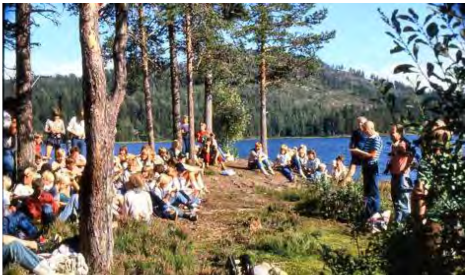
Fra et av mange «Klondyke» arrangementer for speiderne.