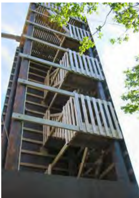
Klatretårnet slik det kan bli.

Vi vil selvsagt søke om best mulig inndekning i forhold til