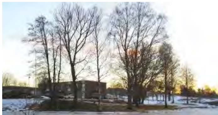
← Speiderhuset i Moss

Helga 7.–9.februar hadde landsgildeledelsen årets første møte i speiderhuset i Nesparken på Moss. Lørdag var alle medlemmer av komiteer og utvalg invitert til inspirasjon, samtaler og planlegging. Møtet ble avsluttet idet dette bladet gikk til trykking, men vi tar med at landsgildeledelsen arbeidet med et svar på høringen om speiderloven, som har frist i mars.