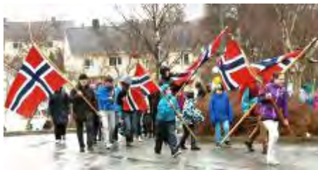
Tekst og foto: Oddveig Bergsager

Det er på St. Georgs dag som jeg selv gjør et poeng av lese «Scouting for Boys» på nytt for å minne meg om hva den inneholder.