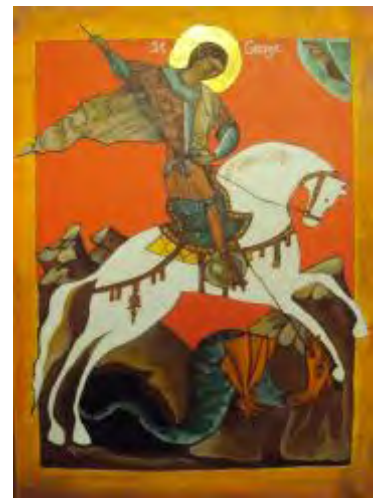
En 15-tallet ikon av St. George fra Novgorod. ↓

«St Georgs dag er 23. april, og på den dagen går alle gode speidere med en rose til hans ære og de heiser flagget. Ikke glem det, neste gang det er 23. april!»