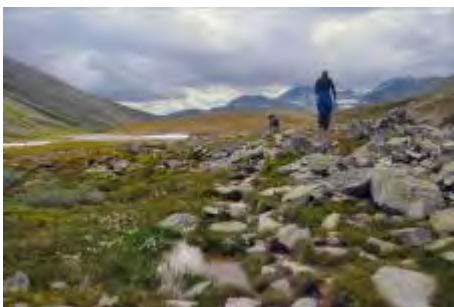
Fra Illmannsdalen, langs stien mellom Bjørnholla og Rondvassbu.