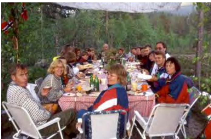
Vi feirer 10 år i Vassfaret

Gildebevegelsen står sterkt i Drammen. 1. St. Georgs Gilde kom til allerede høsten 1945 og lenge før Norsk Speiderguttforbund tenkte tanken, kalte de sin forening for Speidergildet. Så fornøyd var de med organiseringen og navnet at de først i 1954 meldte seg inn i St. Georgs Gildene i Norge. På det meste var de oppe i 61 medlemmer.