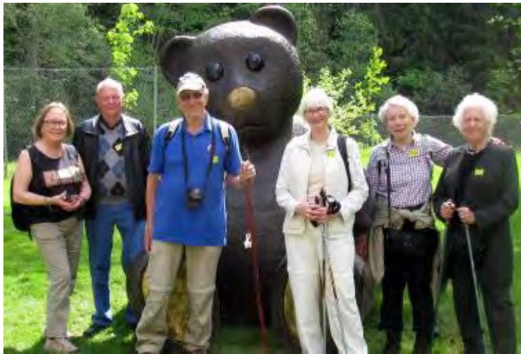
Pilegrimsvandring, Høvik 1 ←

Ikke alle gilder forteller om sine aktiviteter, men de som gjør det viser at gildelivet er meget variert. 20 har gitt detaljer om turer i bil, i kano eller til fots. 1. Høvik har en langtids prosjekt: De skal gå pilgrimsleden til Nidaros, en kort strekning om gangen. Turer hjelper å holde kroppen i form, men som 1. Vestre Aker sier: «De