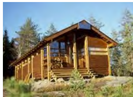
Ny speiderhytta flys inn i marka ved hjelp av Skvadron 720 fra Rygge – Og slik ble hytta.

formål. Mest gikk til Sørvangen arbeidssenter for psykisk utviklingshemmede, som fikk nær 250.000 kroner. Også speiderne i Drammen fikk gode tilskudd til sin drift og en del gikk også til gildets hjertebar, Speiderhytta ved Whiskybekken i Drammens Nordmark. Hytta «eies» av seks tidligere KFUK-speidere og de fleste er medlemmer i vårt gilde. Den brant i 1989 og gildet la ned mange dugnadstimer for å få den gjenreist. Til og med Forsvaret trådte til og fraktet materialene inn med helikopter. Hytta er til stadig utlån for en svært billig penge til speidergrupper og ungdomsforeninger.