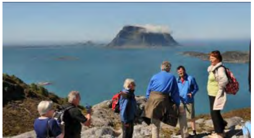
Bergensgilde på sommertur ↑