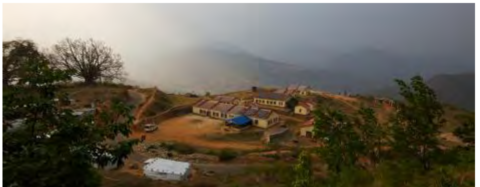
Bayalpata sykehus, Nepal. Prosjekt til 4. Oslo Fagerborg ↑