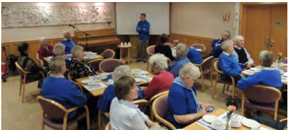
Oslo gildene har formiddagstreff ↑